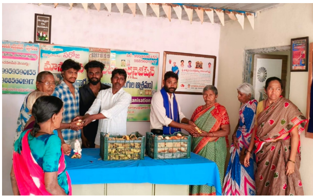
భద్రాచలం, మార్చి 15 (ప్రజా కలం ప్రతినిధి) భద్రాచలం లో బహుజన సమాజ్ పార్టీ స్థాపకుడు బహుజన్ నాయక్ కాన్సీరాం 92వ జయంతి వేడుకలను ఆదివారం ఘనంగా నిర్వహించారు. పుత్ర అంబేద్కర్ యువజన సంఘం మరియు తెలంగాణ సోషలిస్ట్ స్టూడెంట్ అసోసియేషన్ ఆధ్వర్యంలో నిర్వహించిన ఈ

బహుజన రాజకీయాలకు దిశానిర్దేశం చేసిన మహానేత కాన్సీరాం --