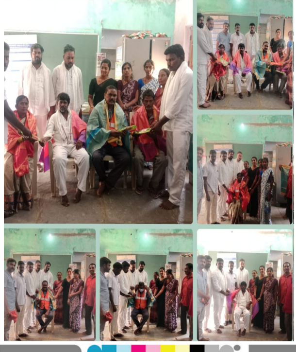
పాలేరు మార్చి 15 (ప్రజా కలం సన్మాన్)

-పంపిణీ చేసిన సర్పంచ్ చీటూరి రాజు. (వరంగల్/పర్వతగిరి) మార్చి 15 ప్రజాకలం ప్రతినిధి: వర్తన్నపేట మండలం అంబేద్కర్ నగర్ గ్రామపంచాయతీలో ప్రజా పాలన--ప్రగతి ప్రణాళిక 99 రోజుల కార్యాచరణలో భాగంగా పాలిశుద్ధ్య కార్మికులను సన్మానించి వారికి పీపీఈ కిట్లు అందజేశారు. ఈ కార్యక్రమాన్ని గౌరవ సర్పంచ్ శ్రీ చీటూరి రాజు ఆధ్వర్యంలో నిర్వహించారు. గ్రామ పరిశుభ్రత కోసం కృషి చేస్తున్న పాలిశుద్ధ్య కార్మికుల సేవలను గుర్తిస్తూ వారికి సన్మానం చేసి పీపీఈ కిట్లు పంపిణీ చేశారు. ఈ సందర్భంగా గ్రామ పరిశుభ్రతలో పాలిశుద్ధ్య కార్మికుల పాత్ర ఎంతో కీలకమని సర్పంచ్ చీటూరి రాజు పేర్కొన్నారు. వారి ఆరోగ్యం, భద్రత దృష్ట్యా పీపీఈ కిట్లు అందజేస్తున్నామని తెలిపారు. ఈ కార్యక్రమంలో ఉప సర్పంచ్, వార్డు సభ్యులు పాల్గొని పాలిశుద్ధ్య కార్మికులను అభినందించారు. కార్యక్రమంలో పంచాయతీ కార్యదర్శి అంబేద్కర్ నగర్ (బిసి)తో పాటు గ్రామపంచాయతీ సిబ్బంది, ఇతరులు పాల్గొన్నారు.