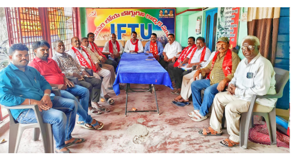
పెద్దపల్లి, మార్చి 29: (ప్రజాకలం జిల్లా ప్రతినిధి)

ఏప్రిల్ 1న కలెక్టరేట్ ముట్టడికి తరలిరండి - జిల్లా కార్మిక సంఘాల జేపీసీ పిలుపు