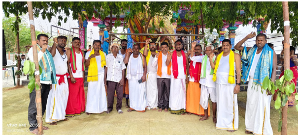
గజ్వేల్: 31 మార్చి 2026 (ప్రజా కలం ప్రతినీధి)

-భక్తిశ్రద్ధలతో ముత్యాలమ్మ, నల్ల పోచమ్మ వేడుకలు