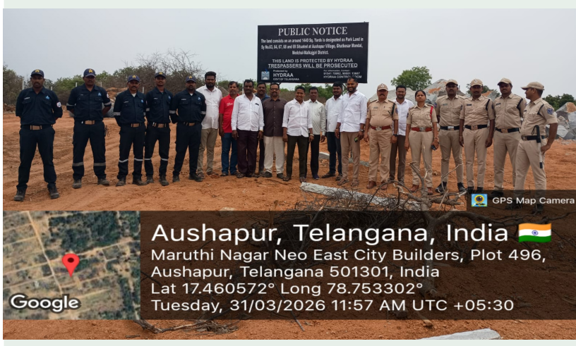
హైదరాబాద్, మార్చి 31 (ప్రజా కలం ప్రతినది)

-బౌరంపేటలో రోడ్డుపై షెడ్ల తొలగింపు; అవుషాపూర్ లో పార్కు స్థలం రక్షణ