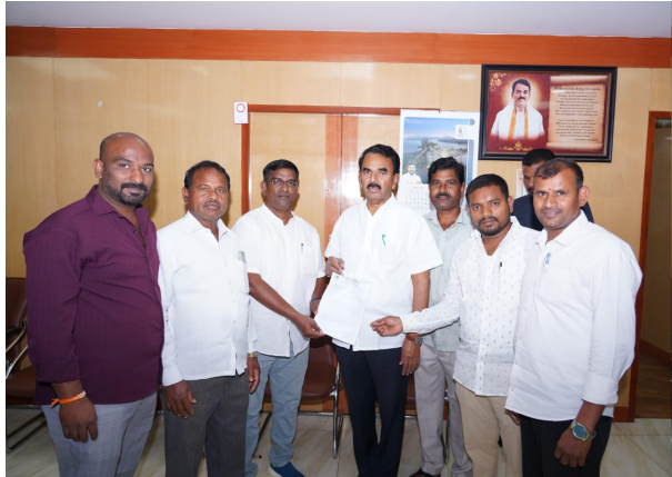
కూకట్ పల్లి, మార్చి 31, ప్రజా కలం ప్రతినీధి:

నగరంలో పాలమూరు బిడ్డలకు కార్పొరేటర్ టీకెట్లు కేటాయించండి.