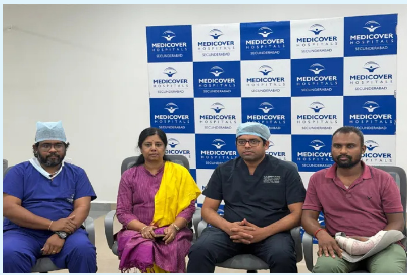
సాగిన ఈ శస్త్రచికిత్సలో ఎముకలను షేటింగ్ ద్వారా స్థిరపరచడం, అల్ట్రా ఆర్థో మరియు రెండు పిస్టను మరమ్మత్తు చేసి రక్తప్రసరణను పునరుద్ధరించడం, టెండన్స్ పునర్నిర్మాణం మరియు నరాల సూక్ష్మ మరమ్మత్తు చేపట్టారు. శస్త్రచికిత్స అనంతరం రోగి చేతిలో రక్తప్రసరణ

మెడికల్ హాస్పిటల్స్, నగర్ లో వైద్యులు అత్యంత క్లిష్టమైన మైక్రో సర్జరీ ద్వారా దాదాపు పూర్తిగా తెగిపోయిన ఎడమ చేతి ముందుభాగాన్ని (ఫోర్ ఆర్మ్) విజయవంతంగా మళ్లీ అమర్చి రోగి చేతిని కాపాడారు. రోగి మల్టీప్లీ తీవ్ర ప్రమాదానికి గురై ఎడమ చేతి ముందుభాగం దాదాపు పూర్తిగా తెగిపోవడంతో అత్యవసర విభాగానికి చేరుకున్నారు. చేతి భాగం కేవలం చిన్న మృదుల కణజాలంతో మాత్రమే అనుసంధానమై ఉండగా, ప్రధాన రక్తనాళాలు, నరాలు, టెండన్సు, రెండు ఎముకలు పూర్తిగా దెబ్బతిన్నాయి. ఈ పరిస్థితి అత్యవసరమని గుర్తించిన ట్రామా సర్జరీ బృందం (ప్లాస్టిక్ సర్జరీ మరియు ఆర్థోపెడిక్స్) వెంటనే శస్త్రచికిత్స ప్రారంభించింది. సుమారు 7 గంటల పాటు