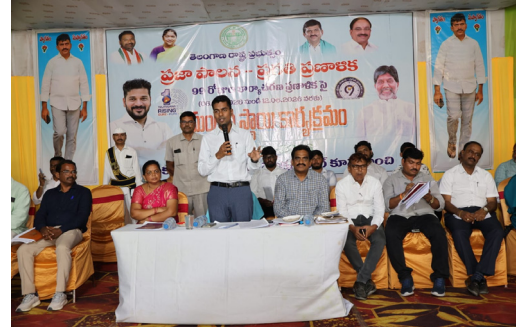
పాలేరు ఏప్రిల్ 16 (ప్రజా కలం స్వర్ణ) జిల్లాలో 99 రోజుల ప్రజాపాలన ప్రగతి ప్రణాళిక