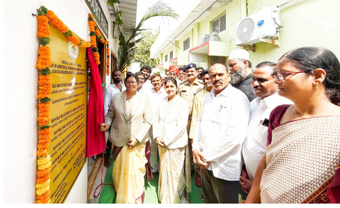
పెద్దపల్లి, ఏప్రిల్ 18: (ప్రజాకలం జిల్లా ప్రతినిధి)