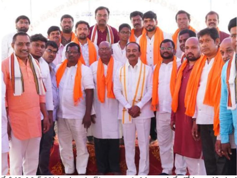
మెడిపల్లె ఏప్రిల్ 28(ప్రజాకలం న్యూస్)