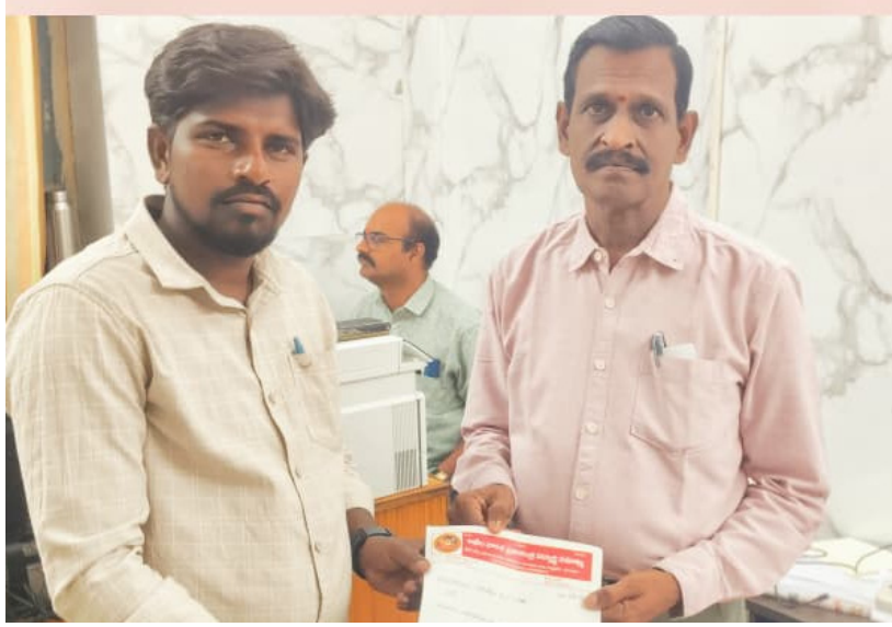
అనంతవరం, ఏప్రిల్ 29 (ప్రజాకలం) :

ప్రైవేటు కార్పొరేట్ విద్యాసంస్థల హాస్పల్లకు తప్పనిసరిగా అనుమతులు తీసుకునేలా కఠిన నిబంధనలు అమలు చేయాలని ఏఐఎఫ్డీఎస్ విద్యార్థి సంఘం డిమాండ్ చేసింది. పర్మిషన్లు లేకుండా హాస్పల్లను నడపనివ్వబోమని సంఘం రాష్ట్ర అధ్యక్షుడు సిఎం సిద్ధు హెచ్చరించారు. జిల్లా కేంద్రంలో పాటూ పరిసర ప్రాంతాలు, పొరుగు జిల్లాల నుంచి వచ్చిన లక్షలాది మంది విద్యార్థులు ప్రైవేటు స్కూల్స్, కాలేజీల హాస్పల్లలో ఉంటూ విద్యాభ్యాసం కొనసాగిస్తున్నారు. అయితే, అనేక హాస్పల్లలో విద్యులవిడిగి ఫీజులు వసూలు చేస్తూ, కనీస సౌకర్యాలు కల్పించకపోవడం ఆందోళన కలిగిస్తున్నదని పేర్కొన్నారు. ప్రభుత్వ హాస్పల్లకు ఉన్న విధానాలు ప్రైవేటు హాస్పల్లకు