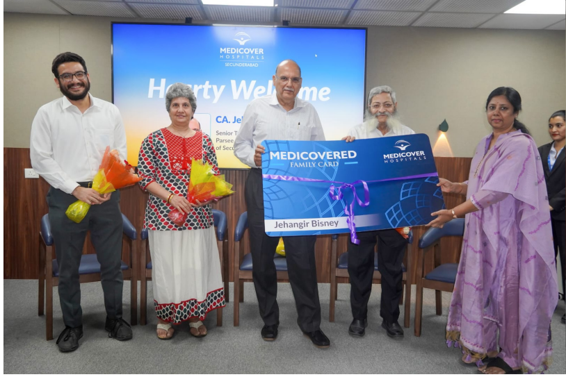
హైదరాబాద్, ఏప్రిల్ 28 (ప్రజాకలం) :

మెడికవర్లో బ్లూ ప్లానెట్ ఆడిటోరియం ప్రారంభం