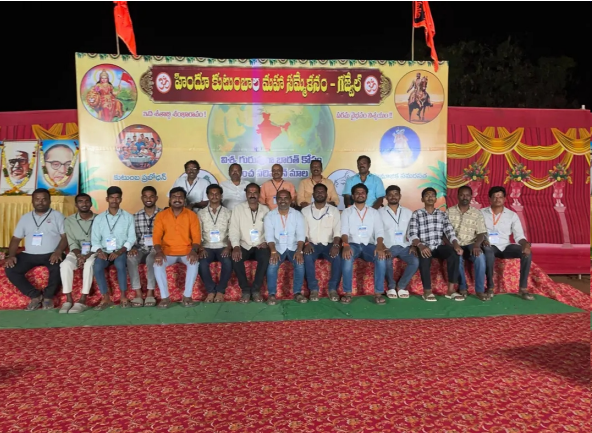
ప్రతినిధులు, పెద్ద ఎత్తున హిందూ ఉత్సవ సమితి సభ్యులు, హైందవ సోదరులు, హిందూ సమాజం, ప్రజలు తదితరులు పాల్గొన్నారు

గజ్వేల్ : 05 ఏప్రిల్ 2026 ( ప్రజా కలం ప్రతినిధి ) హిందూ సమ్మేళన ఉత్సవ సమితి గజ్వేల్ వారి ఆధ్వర్యంలో గడప లోపల కులం గడప దాటితే హిందూవులం అనే నినాదంతో హిందూ సమాజాన్ని ఏకతాటిపైకి తీసుకురావడానికి గజ్వేల్ లో ఘనంగా హిందూ కుటుంబాల మహా సమ్మేళనం నిర్వహించారు, మహిళలు సాంప్రదాయ దుస్తులతో, భగవద్గీత పారాయణం, కోలాటం ఆటపాటలు, ప్రత్యేక ఆకర్షణగా నిలిచాయి చిన్నారులు, భక్తి పాటలు పాడారు, యువకులు ఉత్సాహంగా కార్యక్రమంలో పాల్గొన్నారు, హోమం నిర్వహించి, అల్పాహారం అందజేశారు. ఈ సందర్భంగా ఆర్ఎస్ఎస్ ప్రతినిధులు, సామాజిక సమరసత వేదిక నేతలు, ముఖ్య వక్తులు మాట్లాడుతూ న.నా.త.న. ధర్మ రక్షణ, కుటుంబ వ్యవస్థ బలోపేతం, సామాజిక సమరసత గురించి వివరించారు, నేటి తరం పిల్లలకు భారతీయ సంస్కృతి విలువలను చాలి చెప్పాల్సిని బాధ్యత ప్రతి ఒక్కరికీ ఉందన్నారు, ఈ కార్యక్రమంలో ఆర్ఎస్ఎస్