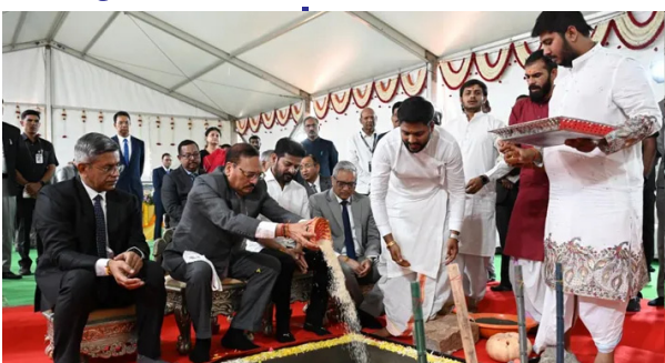
మొదటి పేజీ తరువాయి...