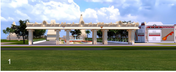
మొదటి పేజీ తరువాయి...