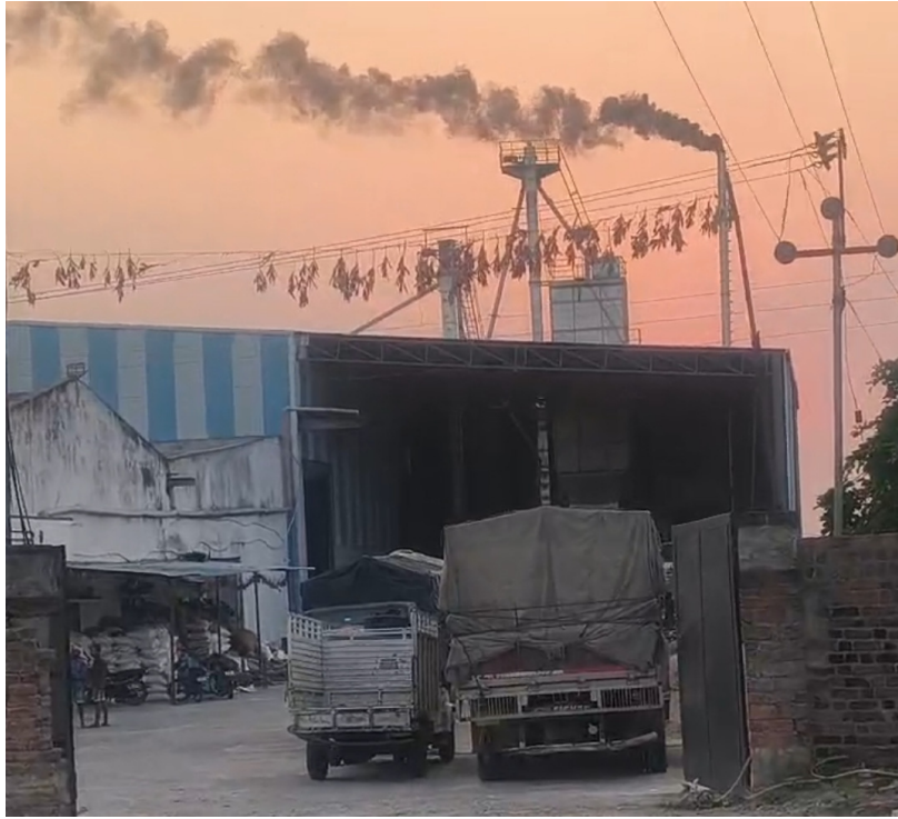
పరిశ్రమలు కాలుష్య నియంత్రణ పరికరాలు ఏర్పాటు చేయడం తప్పనిసరి. ఈ నిబంధనలు ఉల్లంఘించిన రైస్ మిల్ పై కాలుష్య నియంత్రణ మండలి (పి సి బి) అధికారులు వెంటనే తనిఖీలు నిర్వహించి, అవసరమైతే రైస్ మిల్ ను సీజ్ చేసి కఠిన చర్యలు తీసుకోవాలని గ్రామస్థులు డిమాండ్ చేస్తున్నారు. తక్షణ చర్యలు తీసుకోకపోతే రైస్ మిల్ ముందు భారీ స్టాయిల్ ధర్మా చేవడతామని మూడు గ్రామాల ప్రజలు హెచ్చరిస్తున్నారు. సమస్యను వెంటనే పరిష్కరించాలని ప్రభుత్వాన్ని కోరుతున్నారు.

పడుతున్నారని గ్రామస్థులు చెబుతున్నారు. పంటలపై తీవ్ర ప్రభావం రైస్ మిల్ నుండి వచ్చే పొగ సమీపంలోని పంట పొలాలపై పడుతూ పంటలను దెబ్బతీసింది. వచ్చని పంటలు ఎండిపోతూ రైతులకు నష్టం కలుగుతోందని రైతులు వాపోతున్నారు. దీంతో రైతులు ఆర్థికంగా తీవ్రంగా నష్టపోతున్న పరిస్థితి ఏర్పడింది. చర్యలు తీసుకోని అధికారులు ఇంతటి సమస్య ఉన్నప్పటికీ సంబంధిత శాఖల అధికారులు ఇప్పటివరకు ఎలాంటి చర్యలు తీసుకోకపోవడం పట్ల గ్రామస్థులు ఆగ్రహం వ్యక్తం చేస్తున్నారు. ప్రజల ప్రాణాలు పోతున్నా పట్టించుకోకపోవడం బాధాకరమని వారు అంటున్నారు. కాలుష్య చట్టాల ప్రకారం చర్యలు తీసుకోవాలి పర్యావరణ పరిరక్షణ చట్టాలు, గాలి కాలుష్య నియంత్రణ నిబంధనలు (ఎయిర్ పాల్యూషన్ కంట్రోల్ యాక్ట్) ప్రకారం