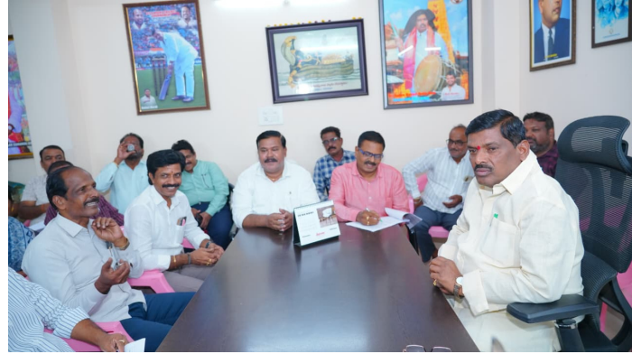
పటాన్ చేరు, జూన్ 9 (ప్రజా కలం) ప్రతినిధి