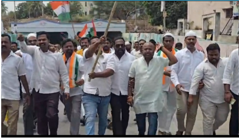
మైనంపల్లి కృషితోనే 960 కోట్ల సికింద్రాబాద్ -మల్కాజిగిరి ఎలివేటెడ్ కారిడార్ నిధులు