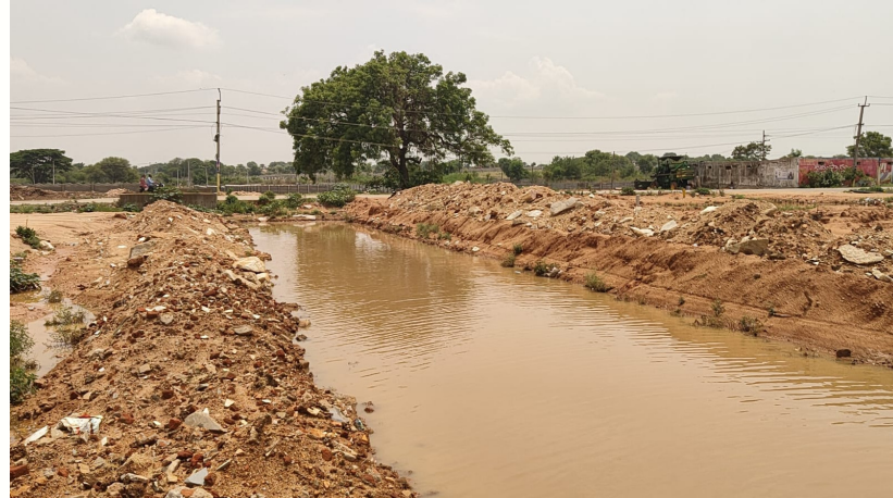
మహేశ్వరం, జూన్ 09, (ప్రజా కలం)

రంగారెడ్డి జిల్లా మహేశ్వరం మండలం తుమ్మలూరు రోడ్డుకు కొత్తగా ఏర్పాటు చేసిన అక్షిత వెంచర్ కారణంగా కాలనీలో ఉండే వివాసాలలోకి వర్షం నీరు ఇండ్లలోకి వెళ్లి ప్రజలకు చాలా ఇబ్బందులు కలుగుతున్నాయని స్థానిక ప్రజలు ఆందోళన వ్యక్తం చేశారు. పొద్ది కుంట లోకి వర్షపు నీరు వెళ్లకుండా అడ్డుగా వెంచర్ చేయడంతో వర్షాలు పడినప్పుడు నీరు ఎటు వెళ్లాలో తెలియక ప్రధాన రహదారిపై పక్కనే ఉన్న నివాసాలకు వర్షపు నీరు వెళ్తుంది. దీని కారణంగా ప్రతిసారి వర్షం పడినప్పుడు ప్రజలకు ఇబ్బందులు కలుగుతున్నాయని ప్రజలు ఆందోళన వ్యక్తం చేస్తున్నారు. గతంలో పలు పత్రికలో కథనాలు వచ్చిన మహేశ్వరం గ్రామపంచాయతీ నోటీసులు ఇచ్చిన అక్షిత వెంచర్ యజమాన్యం పట్టించుకోలేదు మళ్ళీ రాత్రి కురిసిన వర్షానికి