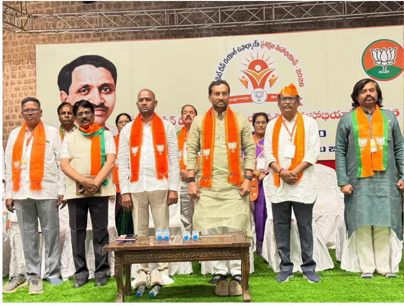
గజ్వేల్ నియోజకవర్గం: 10 జూన్ 2026 ( ప్రజా కలం ప్రతినిధి)

దేశాన్ని అత్యధిక కాలం సేవలందించిన ప్రధానిగా నరేంద్ర మోదీ చరిత్ర సృష్టించారు ప్రజాస్వామ్యాన్ని అపహాస్యం చేసింది కాంగ్రెస్ పార్టీయే - ఎంపీ రఘునందన్ రావు