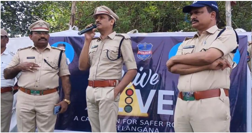
కంటోన్మెంట్: జూన్ 10: ప్రజాకలం ప్రతినిధి