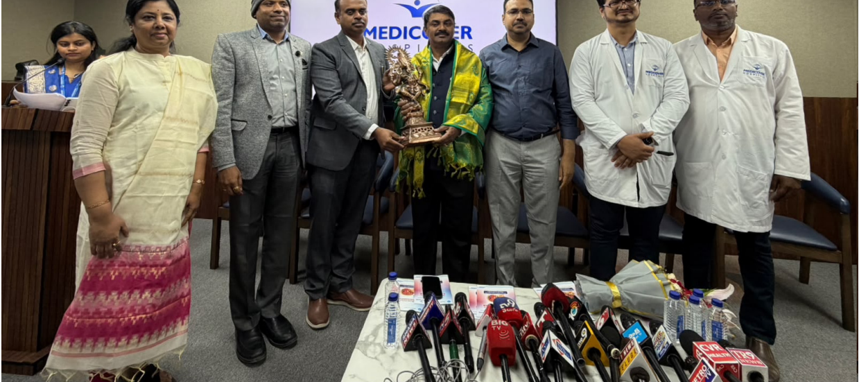
హైదరాబాద్, జూన్ 10 ప్రజాకలం ప్రతినిధి