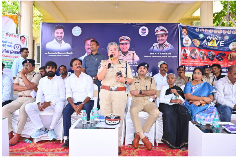
భూదాన్ పోచంపల్లి జూన్ 10 (ప్రజా కలం)

- రాష్ట్ర పోలీస్ అకాడమీ డైరెక్టర్ అభిలాష్ బిస్త్ ఐపీఎస్ - రాష్ట్ర ప్రజల సస్య శ్యామలమే మన లక్ష్యం -ఎమ్మెల్యే కుంభం - ద్విచక్ర వాహనదారులకు హెల్మెట్ తప్పనిసరి -జిల్లా ఎస్పీ ఆకాంక్ష యాదవ్