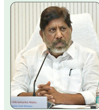
పెద్దపల్లి, జూన్ 19 (ప్రజాకలం) : ప్రభుత్వానికి ఆదాయ వనరులు తీసుకువచ్చే రంగాలపై పూర్తిగా దృష్టి పెట్టాలని ఉప ముఖ్యమంత్రి భట్టి విక్రమార్క చెప్పారు. మన వనరులే మన పెట్టుబడి అని ఆయన అన్నారు. శుక్రవారం నాడు బాబానాహెల్ అంబేద్కర్ సచివాలయంలో ఆదాయ వనరుల సమీక్షలో మంత్రివర్గ ఉప సంచార సమావేశమైంది. ఈ సమావేశంలో మంత్రులు ఉత్తమ్ కుమార్ రెడ్డి, జూపల్లి కృష్ణారావు పాల్గొన్నారు. ఈ సందర్భంగా ఉప ముఖ్యమంత్రి

పొంగు రాష్ట్రాలకు ఇసుక ఎగుమతిపై అధ్యయనం పీపీసీ మోడల్ లో పర్యాటక ఆస్తుల అభివృద్ధి - బెంపుల్, ఎకో, హెల్త్ టూరిజంపై దూకుడు పర్యాటకం, రిజిస్ట్రేషన్లపై ప్రత్యేక దృష్టి : డిప్యూటీ సీఎం భట్టి విక్రమార్క