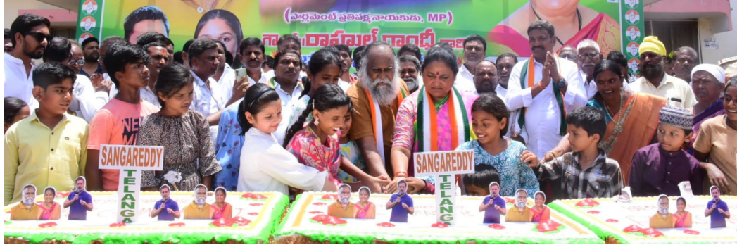
సంగారెడ్డి ప్రతినిధి జూన్ 19 (ప్రజా కలం):