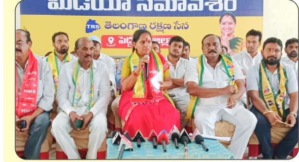
పెద్దపల్లి, జూన్ 19: (ప్రజాకలం జిల్లాప్రతినిధి) రాష్ట్రంలోని కాంగ్రెస్ ప్రభుత్వ ప్రజా వ్యతిరేక విధానాలు, సింగరేణిలో నెలకొన్న అప్రకటిత ఎమ్మెల్యే జిల్లాలోని ప్రధాన సమస్యలపై తెలంగాణ రక్షణ సేన రాజీలేని పోరాటం చేస్తుందని ఆ పార్టీ అధ్యక్షురాలు కల్యాణకుంట్ల కవిత స్పష్టం చేశారు. ఉమ్మడి ఆదిలాబాద్, కరీంనగర్ జిల్లాల్లో నాలుగు రోజుల పాటు సాగిన బొగ్గుబాయి బాట యాత్ర ముగింపు సందర్భంగా శుక్రవారం ఆమె పెద్దపల్లికి చేరుకున్నారు.

ప్రజా సమస్యలే అజెండాగా తెలంగాణ రక్షణ సేన - ప్రజలే ఎజెండాగా తెలంగాణ రక్షణ సేన పార్టీ పుట్టింది జిల్లాలో టీఆర్ఎస్ బోగ్గు బాయి బాట - టీఆర్ఎస్ అధ్యక్షురాలు కల్యాణకుంట్ల కవిత