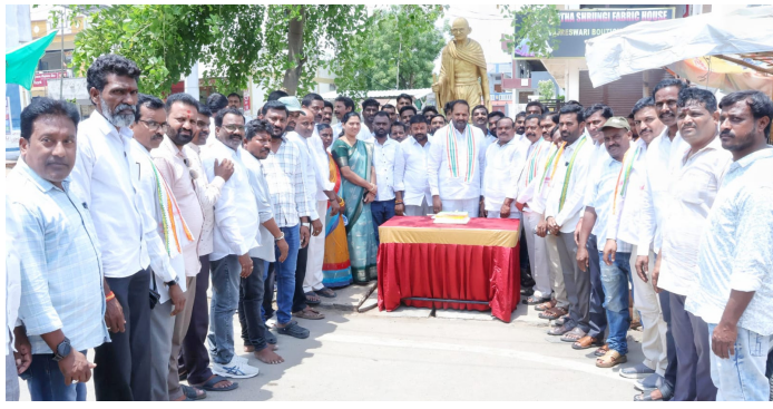
పెద్దపల్లి, జూన్ 19: (ప్రజాకలం జిల్లా ప్రతినిధి)