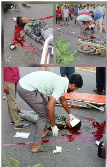
(నందిగామ జూన్ 19 ప్రజా కలం ప్రతినిధి)